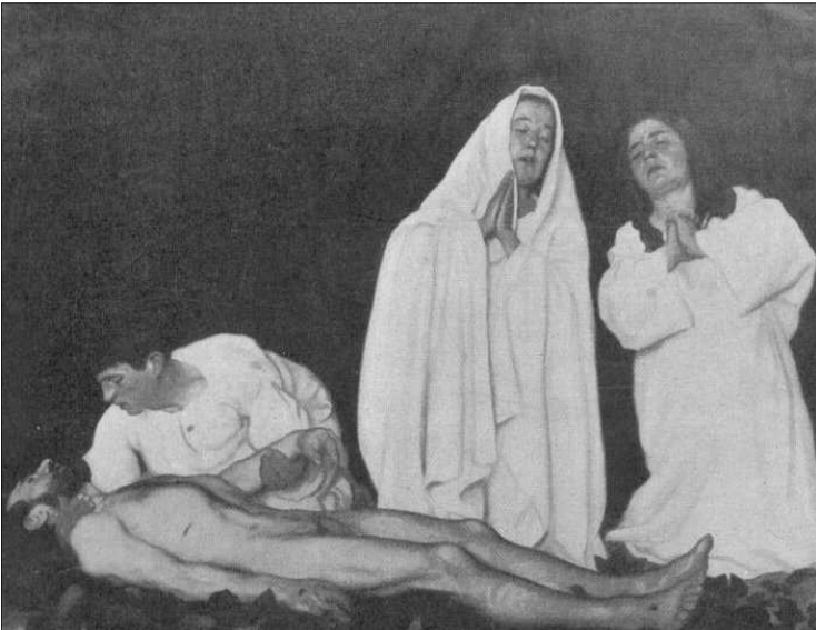
Ferenczy Károly: Piéta