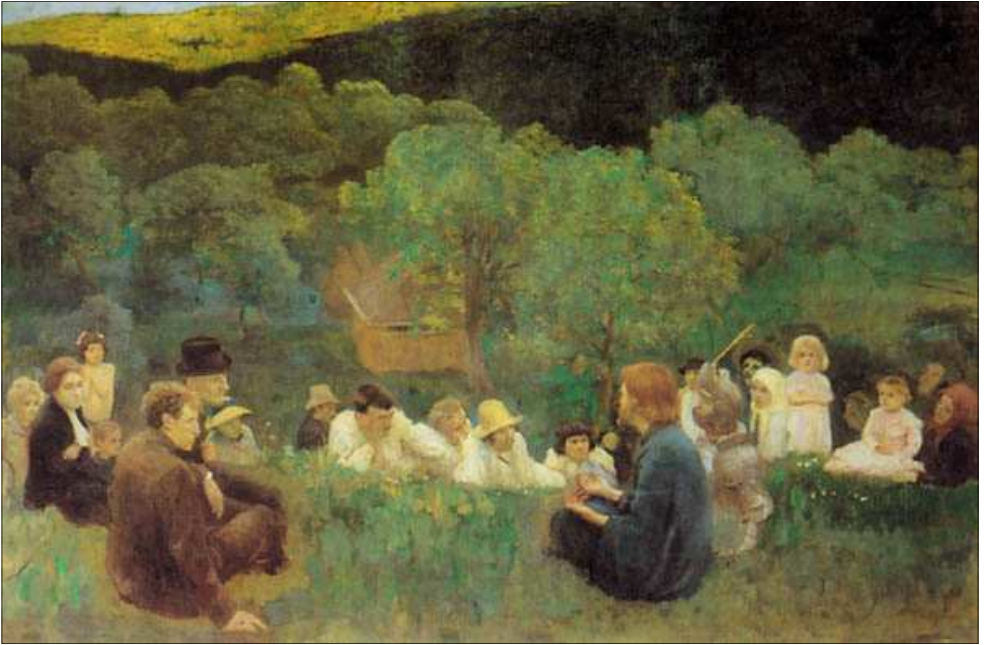
Ferenczy Károly: A hegyibeszéd