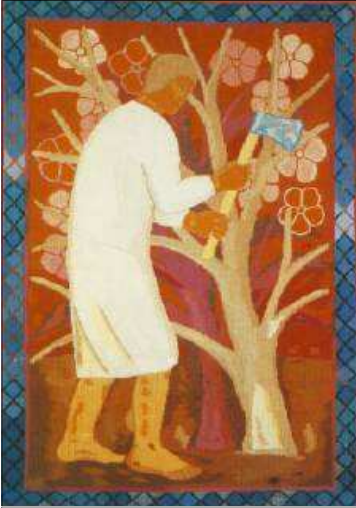
Ferenczy Noémi: Korhadt fa

„Vala egy embernek egy fügefája szőléjébe ültetve; és elméne, hogy azon gyümölcsöt keressen, és nem találá. És monda a vinczellérnek: Ímé három esztendeje járok gyümölcsöt keresni e fügefán, és nem találok: vágd ki azt; mért foglalja a földet is hiába? Az pedig felelvén, monda néki: Uram, hagyj békét néki még ez esztendőben, míg köröskörül megkapálom és megrágyázom: És ha gyümölcsöt terem, jó; ha pedig nem, azután vágd ki azt.”